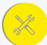
Des ateliers équipés de postes de travail