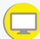
Des salles de cours connectées