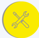
Des ateliers équipés de postes de travail