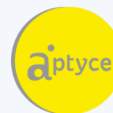
Une plateforme LMS avec des cours en ligne